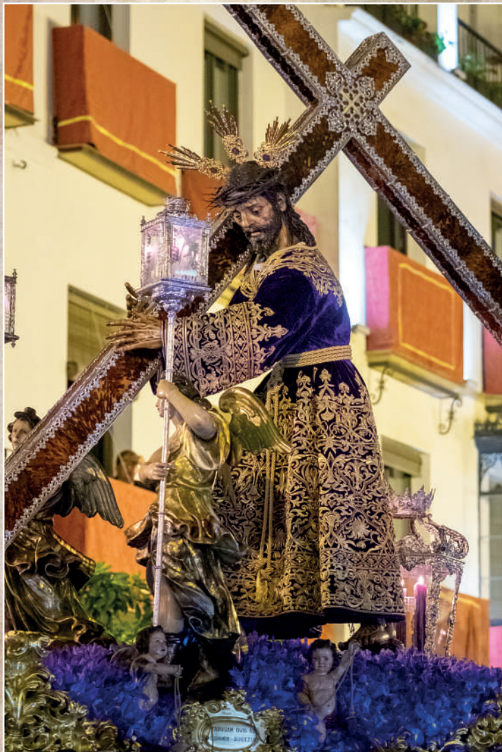
Ntro. Padre Jesús Nazareno (El Silencio)