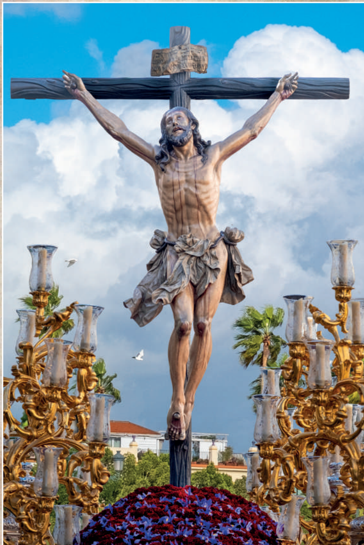
Stmo. Cristo de la Expiración (El Cachorro)