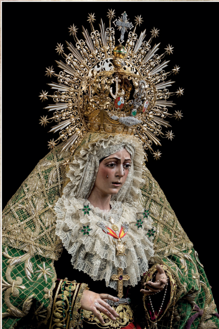
María Santísima de La Esperanza Macarena