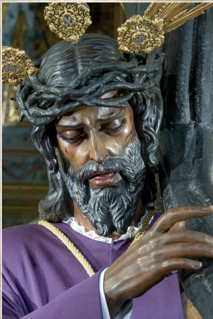
Nuestro Padre Jesús de la Salud (Los Gitanos)