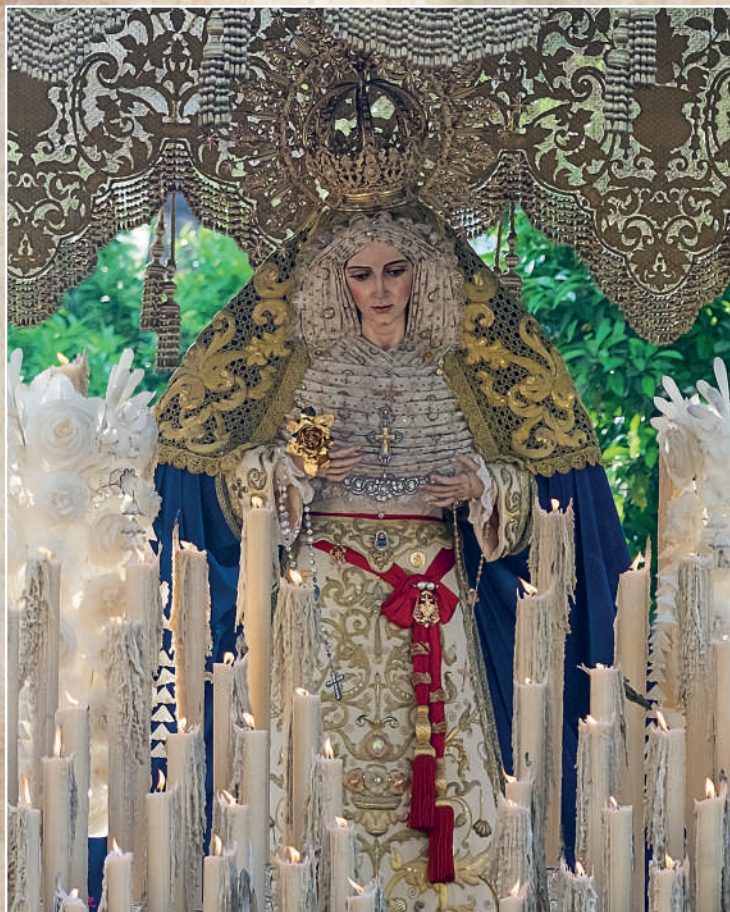
Ntra. Sra. de la Aurora (La Resurrección)

SALIDA: 8,30 - Arrayán: 9,30 - Trajano: 10,30 - Duque: 10,45 - Campana: 11,00 - Plaza: 11,40 - Catedral: 12,25 Placentines: 13,30 - Bustos Tavera: 14,30 - San Luis: 16,00 - Entrada Palio: 16,30