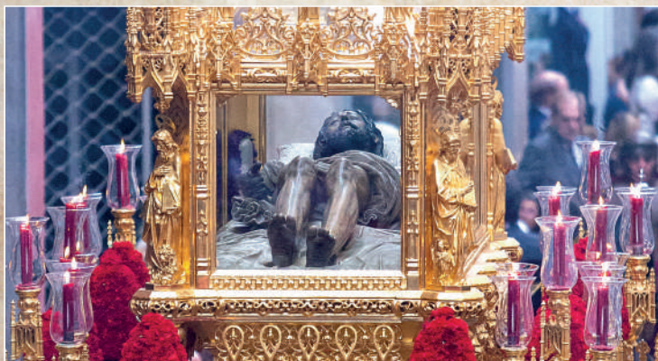
Stmo. Cristo Yacente (Santo Entierro)