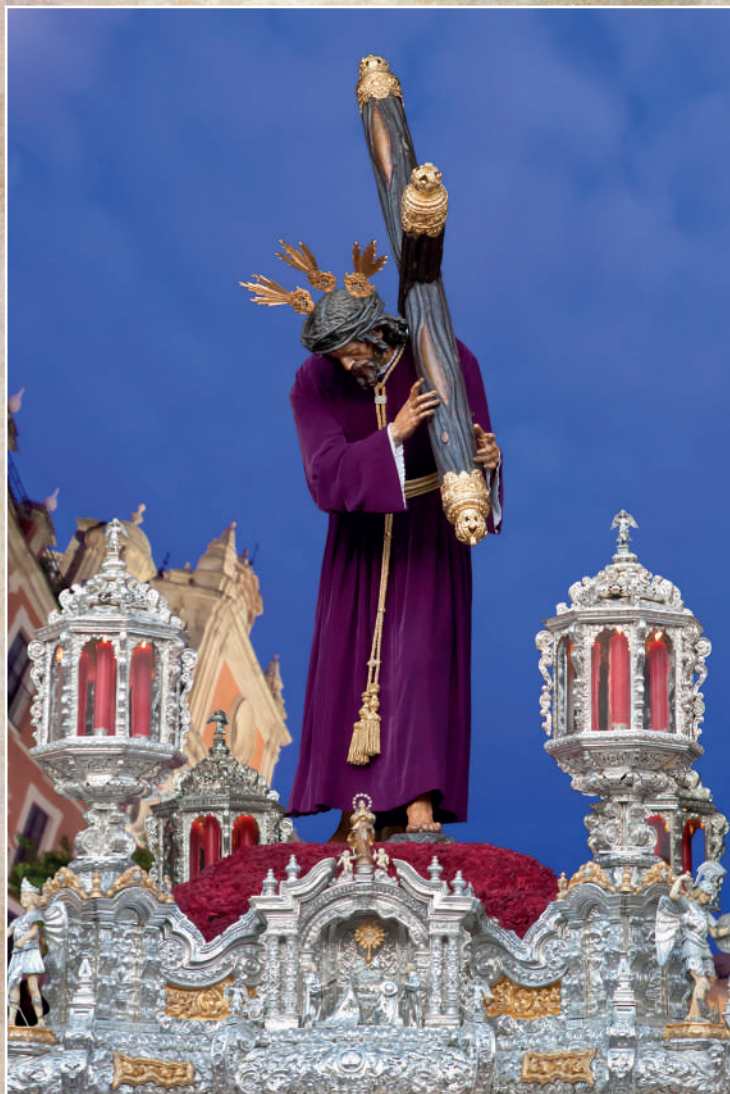
Ntro. Padre Jesús de la Pasión (Pasión)