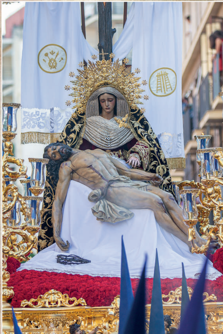
Stmo. Cristo de la Misericordia y Ntra. Sra. de la Piedad (El Baratillo)