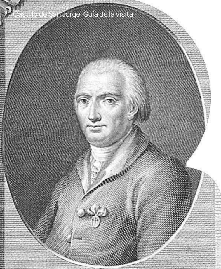
D. PABLO OLAVIDE.