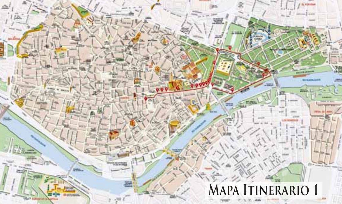
MAPA ITINERARIO 1