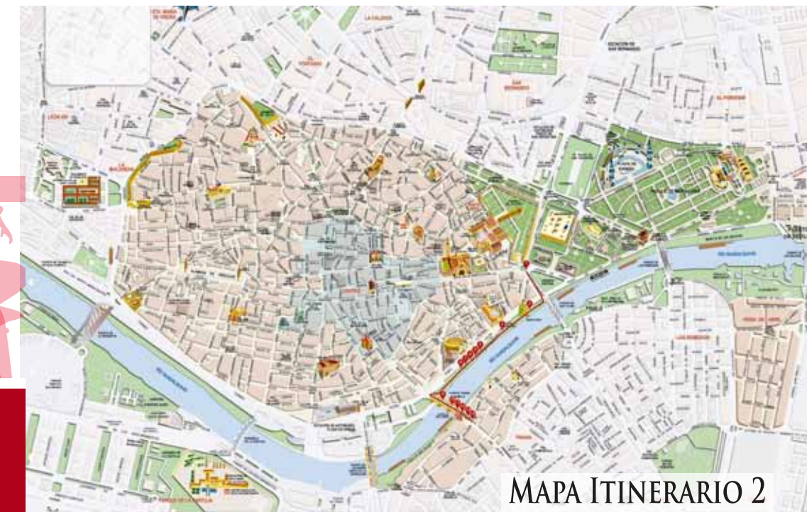
MAPA ITINERARIO 2

In "Seville by bike" you'll have the chance to follow two itineraries within two important zones of Seville: downtown and the Guadalquivir banks .